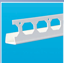
PLACSTOP PVC 8125