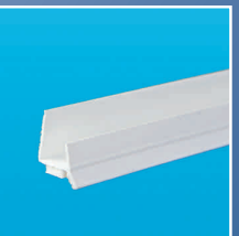
PLACSTOP LIPPE PVC 8825