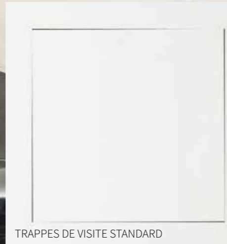
TRAPPES DE VISITE STANDARD

Les trappes de visite traditionnelles doivent être installés séparément, c'est à dire tout d'abord on doit fixer le châssis et après on doit monter la porte, si l'apporteur ne met pas assez d'attention, cela peut provoquer le problème du non-alignement, ou bien que la trappe ne sera pas centrée dans son siège. En outre, les grands stucages sur la porte peuvent souvent abîmer l'angle des bords.