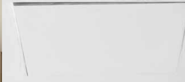
TRAPPES DE VISITE STANDARD

Les trappes de visite standard ont des systèmes de verrouillage fixés sur le châssis par des composants indépendants, s'il y a un peu de variation de l'angle pendant le transport, le montage ou ouverture et fermeture pour la normale utilisation, la porte ne sera plus en ligne avec la plaque de plâtre.